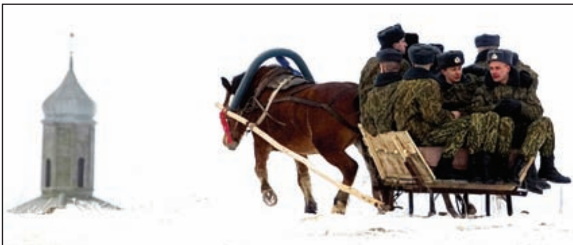
Un grupo di soldanan di Belarius ta core riba un slee lastra pa un cabai celebrando e Pasco Orthodoxo den e pueblo Stochitsy banda di e capital di Belarius diadomingo. Pasco ta cai riba 7 di januari pa e Cristiannan Ortodoxo di e Tera Santo. Rusia y otro iglesianan Ortodoxo ta usa e calender antiguo di Julio.